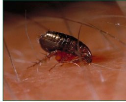
La pulga adulta se alimenta directamente de los animales.

La pulga del gato es la pulga más común en California. A pesar de su nombre, ataca tanto a perros como a gatos y pica también a los humanos. Para mantener a las pulgas fuera del hogar, contrólas en animales domésticos y limpie regularmente las cobijas donde duermen los animales.