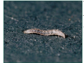
Las larvas de las pulgas comen los restos de animales o mascotas en las alfombras o áreas para dormir.