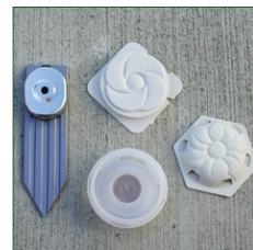
CA Reynolds, UC IPM

Los cebos con pesticidas funcionan atrayendo a las hormigas obreras que luego llevan el producto al nido donde se puede matar a toda la colonia, incluidas las reinas. El pesticida debe ser de acción lenta para que las obreras no mueran antes de que regresen al nido.